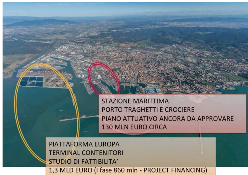
Figura 1: Localizzazione dei progetti a dibattito

Direzione Strumenti di programmazione e sistema informativo portuale