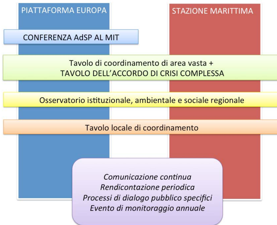
Figura 3 - Lo schema di governance scelto dall'Autorità Portuale

Autorità Portuale di Livorno Direzione Strumenti di programmazione e sistema informativo portuale